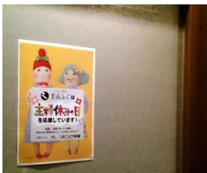
「主婦休みの日」特典として、予約した上でコースを頼むと「ふぐ皮唐揚げ」や「コラーゲン入りジュース」をプレゼント