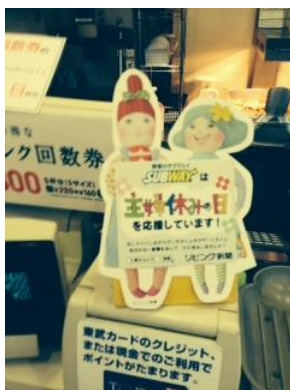
「草加店」では店頭のポスター、レジ横POPなどあちこちで「主婦休み」をアピール