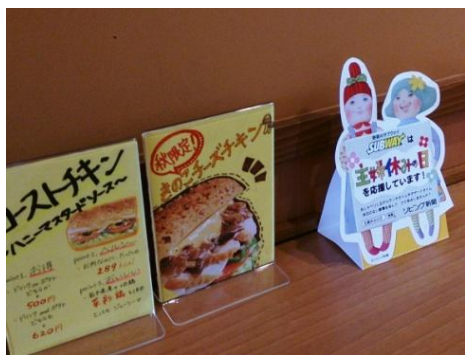
飲食スペースのカウンターにPOPが並んだ「新三郷店」