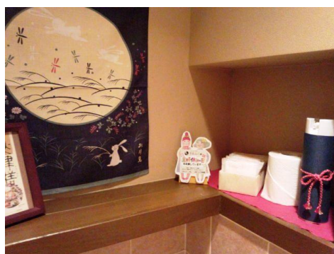
「自由が丘店」(左)では、女性用お手洗いに設置。じっくり読める空間です。「神田店」では、レジ横に設置されたPOPをみて「“主婦休みの日”っていうのがあなのね」とお客様からお声がけいただくことも