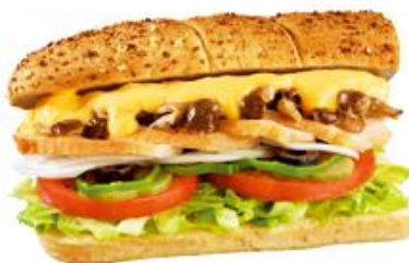
コラボメニュー「主婦休みの日応援セット」は期間限定品が、クーポンを利用でお得に