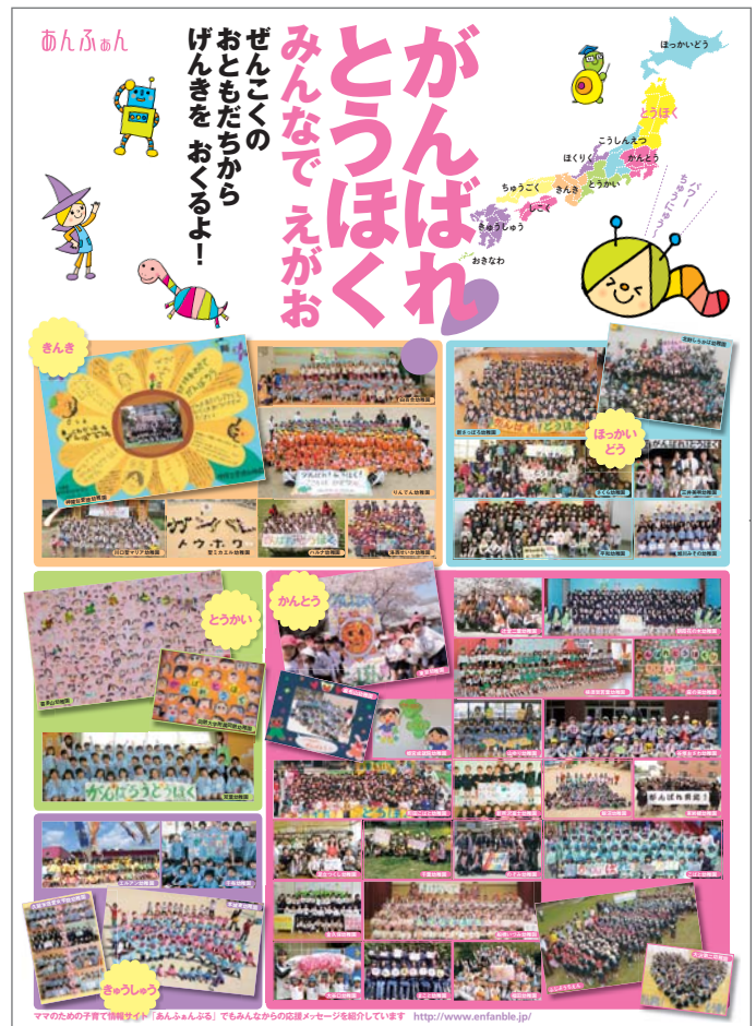
ママのための子育て情報サイト「あんふあんぶる」でもみんなからの応援メッセージを紹介しています http://www.enfanble.jp/

震災後の子どもの心のケアが心配される今、一人でも多くの園児に、心から笑える日常を取り戻してもらえるよう、あんふあんでは『みんなでえがおプロジェクト』として、今後も被災地支援活動を続けていきます。