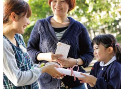
幼稚園ママに聞いた！ 先生に感謝の気持ちを伝える日を「先生ありがとうの日」とする行事をどう思いますか

11月25日、日本全国の園児たちから、先生へ一斉に「ありがとう」のメッセージが送られる日、それが「先生ありがとうの日」です。