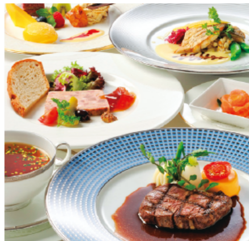
フランス料理「カメラア」のランチ